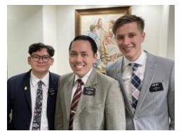
植久保／古我知姉妹 ソウザ／ヌエスカ／スミス長老