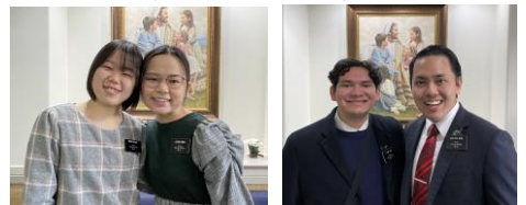
植久保／古我知姉妹 ソウザ／ヌエスカ長老